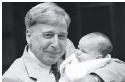
Robert Edwards 與全球首名試管嬰兒 Louise Brown