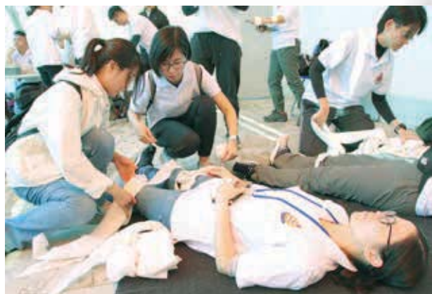
新界東總區聯合訓練