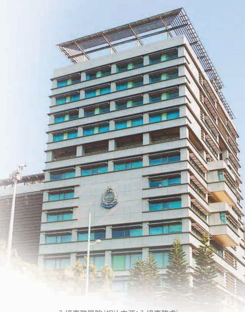
入境事務學院

入境事務處的職員常與當值隊員保持良好的溝通，令我們發揮所學、認識實際工作及加強默契之餘，亦豐富閱歷、見識年青人的活力和堅毅。這當值職務也成為了屯門區的獨特更分。