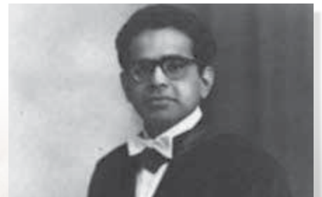
悲劇科學家 Subhash Mukhopadhyay