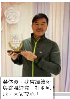
榮休後，我會繼續參與跳舞運動，打羽毛球，大家放心！

我起步遲，加入醫療輔助隊只有短短18年，想當年與醫院管理局幾位同事誤打誤撞加了醫療輔助隊，忽忽的在2016年12月1日就榮休了。在部隊裡學識了救傷扶危、也認識了不同階層的朋友及了解多些不同工作性質的事情，令我更加成長，得到的一定比失去的多。失了什麼？唔可以個個星期日賴床，你們要繼續努力呀！