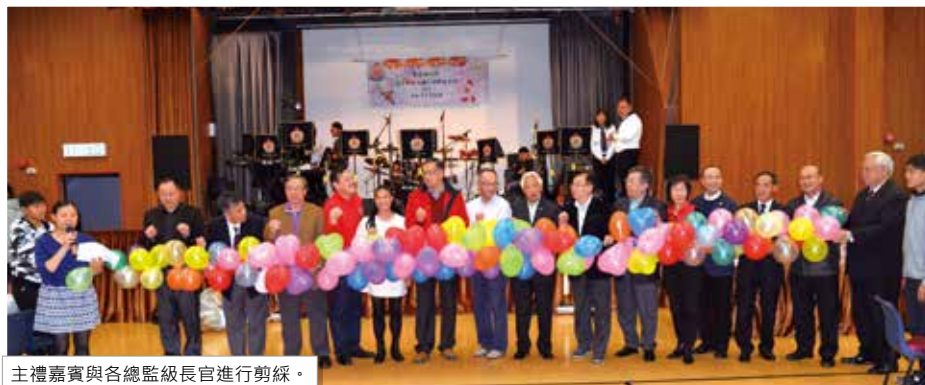
主禮嘉賓與各總監級長官進行剪綵。