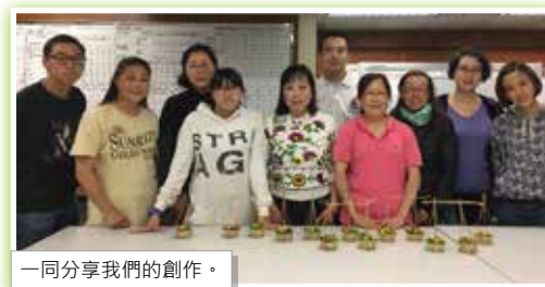
一同分享我們的創作。