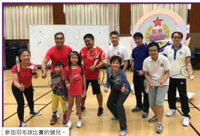
參加羽毛球比賽的健兒。