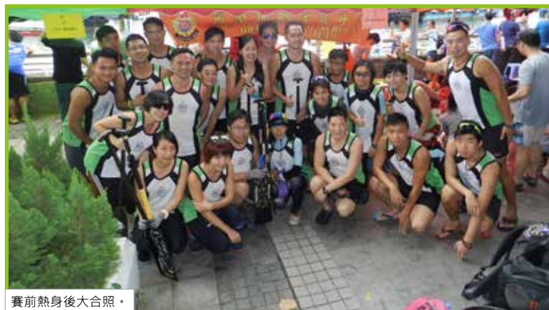
賽前熱身後大合照。