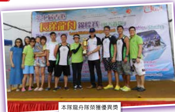
本隊龍舟隊榮獲優異獎