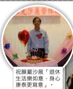
祝願嚴沙展「退休生活樂如意、身心康泰更寫意」。

晚宴結束時，一眾更以一曲「朋友」送上無限的祝福，祝願光師兄「退休生活樂如意、身心康泰更寫意」！