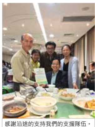
感謝沿途的支持我們的支援隊伍。