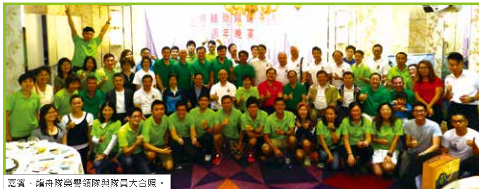
嘉賓、龍舟隊榮譽領隊及隊員大合照。