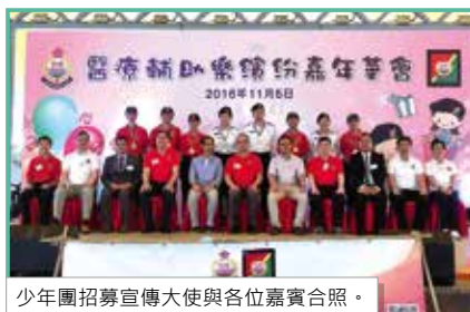
少年團招募宣傳大使與各位嘉賓合照。