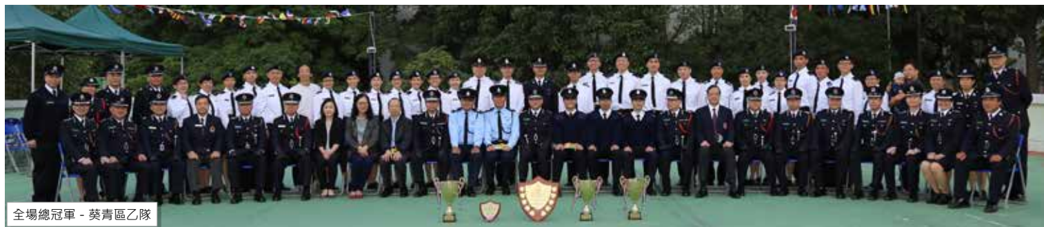
全場總冠軍 - 葵青區乙隊