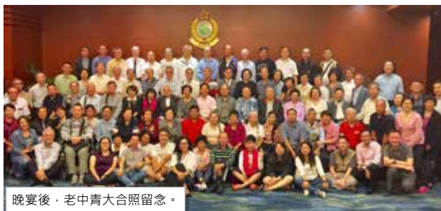
晚宴後，老中青大合照留念。