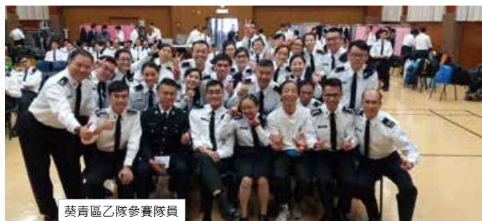
葵青區乙隊參賽隊員