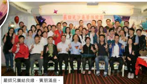
嚴師兄廣結良緣，賓朋滿座。