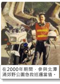
在2000年期間，參與北潭涌郊野公園急救巡邏當值。