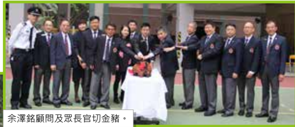
余澤銘顧問及眾長官切金豬。