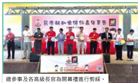
總參事及各高級長官為開幕禮進行剪綵。

醫療輔助隊少年團於2016年11月5日在沙田公園結客場舉行「醫療輔助樂繽紛」活動推廣部隊，並為部隊招募隊員和少年團團員。