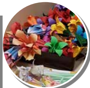
摺上我們的心意送給妳。