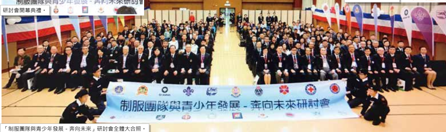
「制服團隊與青少年發展 - 奔向未來」研討會全體大合照。