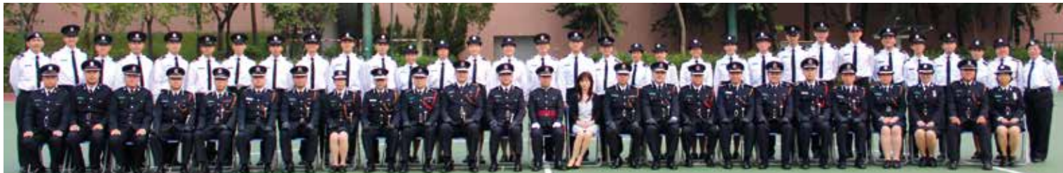
主禮嘉賓伍兆緣先生及各高級長官與第七屆準長官訓練班的畢業學員合照。

2016年12月4日（星期日）為第七屆準長官訓練班暨第九十三屆（R442-R447班）新隊員訓練班結業的大日子。畢業會操當日下午在何文田公園硬地足球場舉行，並有幸獲醫療輔助隊高級助理總監（後勤及支援）伍兆緣先生檢閱會操及為畢業的新隊員主持監誓儀式。伍兆緣先生致辭時勉勵新隊員把握各個學習機會充實自己，提升部隊整體水平。