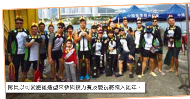
隊員以可愛肥雞造型來參與接力賽及慶祝將踏入雞年。

是次活動是為慶祝中國香港龍舟總會創會25週年及香港國際龍舟邀請賽40週年，所舉辦的「香港龍舟年」壓軸活動。28支龍舟隊伍以每兩隊一組接力形式進行，由2016年12月31日下午3時開始，每組大約於兩小時內，輪流在城門河上接力衝刺，然後交棒予下一組。結果大家在限時結束前1小時完成，成功打破由德國的Irish Pub Punk Team在2014年造出的238.81公里健力士世界紀錄，我們最終以247公里在2017年元旦日創出新紀錄，待成績被確認後，香港龍舟將正式衝出亞洲揚威海外。