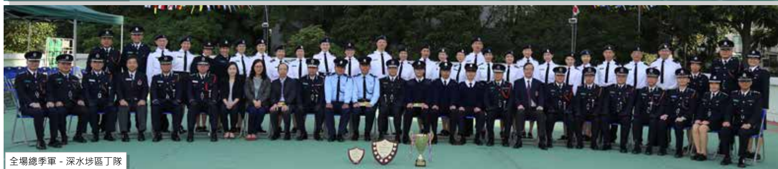
全場總季軍 - 深水埗區丁隊