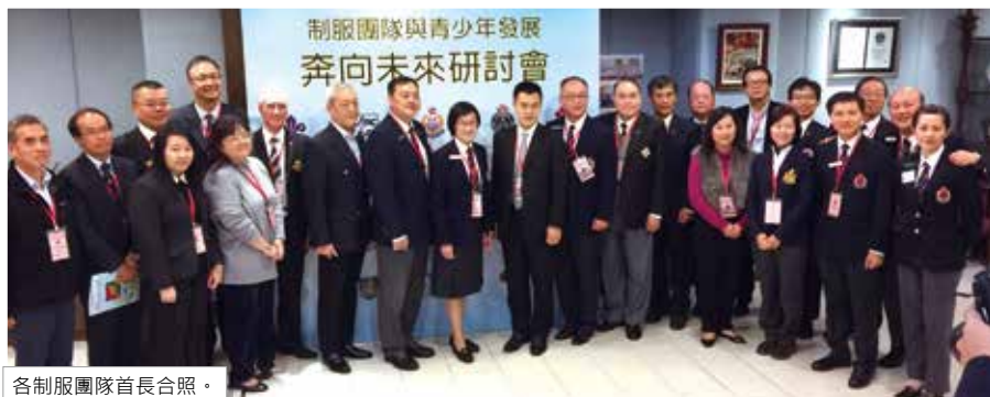
各制服團隊首長合照。

為慶祝成立5周年，醫療輔助隊少年團於2017年1月15日舉行「制服團隊與青少年發展 - 奔向未來」研討會，並取得圓滿的成功。是次研討會有7個專題演講及1個圓桌會議。專題演講涵蓋青少年日常生活的不同範疇，嘉賓講者提出的觀點讓與會者對青少年面臨的挑戰有更深入的了解。而圓桌會議則讓各制服團隊領導就相關的青少年議題互相討論及交流心得，從而令各方能夠制定具前瞻性的策略，幫助青少年找到發展的方向。