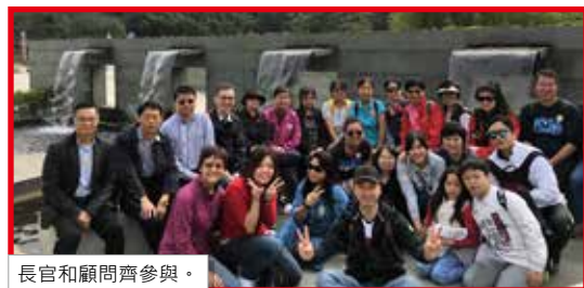
長官和顧問齊參與。