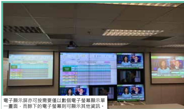
電子顯示屏亦可按需要僅以數個電子螢幕顯示單一畫面，而餘下的電子螢幕則可顯示其他資訊。