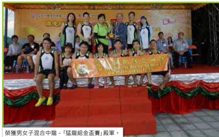
榮獲男女子混合中龍 - 「猛龍組金盃賽」殿軍。