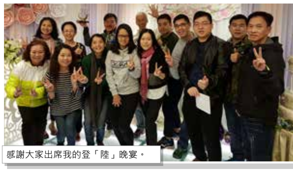
感謝大家出席我的登「陸」晚宴。