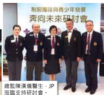
總監陳漢儀醫生·JP蒞臨支持研討會。