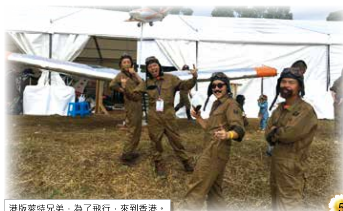
港版萊特兄弟，為了飛行，來到香港。

醫療輔助隊隊員負責駐守兩個救護站及一輛救護車，在現場隨時候命。當值崗位位於啟德跑道公園。雖然四周環境布滿沙石、泥濘及斜坡，但各隊員仍然緊守崗位，有效率地處理傷者傷勢。九龍城區各長官亦在現場指揮，讓行動得以順利進行。