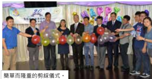
簡單而隆重的剪綵儀式。