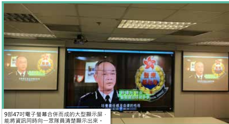
9部47吋電子螢幕合併而成的大型顯示屏，能將資訊同時向一眾隊員清楚顯示出來。

隊員日後在總部控制室為颱風及各項大型活動值勤時，所有資訊便可在電子顯示屏一目了然，從而免卻使用手寫告示板的局限，令部隊無論是部署人手和調配資源，都將會更有效。