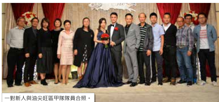
一對新人與油尖旺區中隊隊員合照。