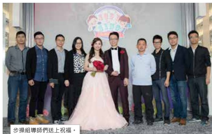
步操組導師們送上祝福。