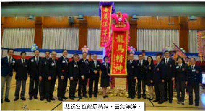
恭祝各位龍馬精神、喜氣洋洋。