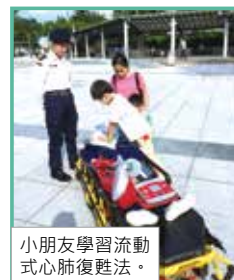
小朋友學習流動式心肺復甦法。