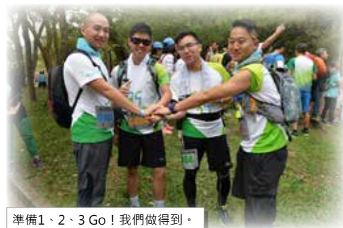
準備1、2、3 Go! 我們做得到。