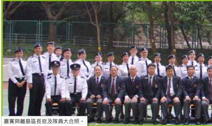
嘉賓與離島區長官及隊員大合照。

2016年11月6日，各離島區長官及隊員歡迎顧問余澤銘先生加入醫療輔助隊。余澤銘顧問在艷陽下檢閱隊伍和向我們致勉勵辭。此外，各區長官及顧問均蒞臨道賀，令場面更添意義。