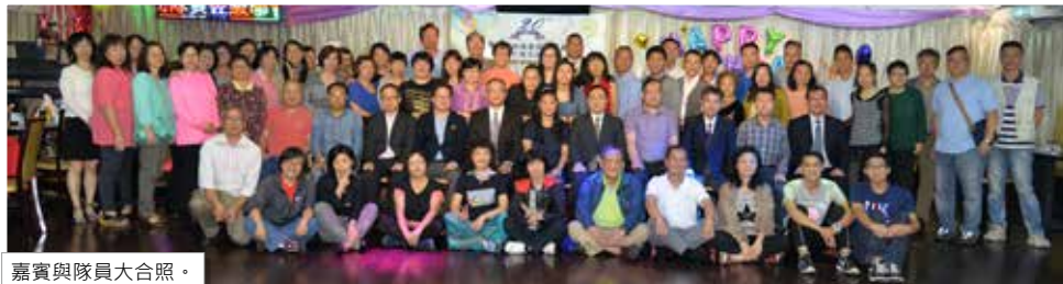
嘉賓與隊員大合照。