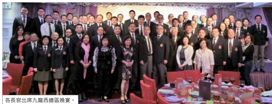
各長官出席九龍西總區晚宴。