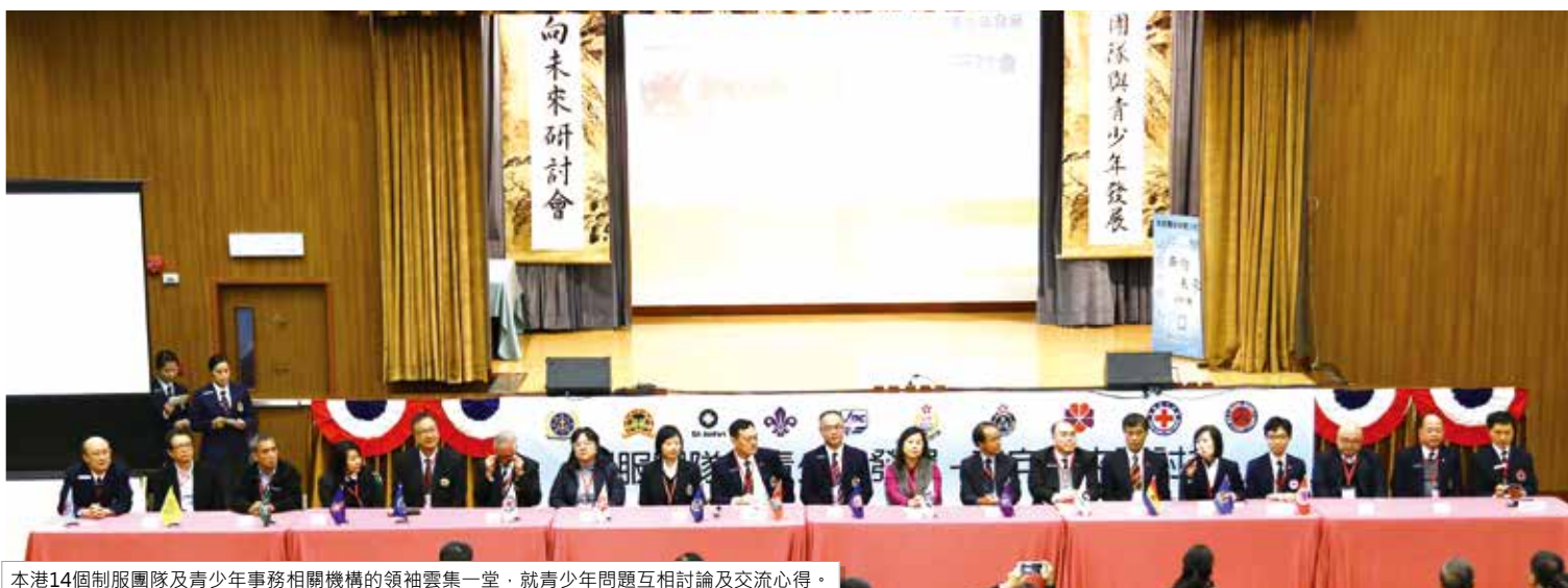
本港14個制服團隊及青少年事務相關機構的領袖雲集一堂，就青少年問題互相討論及交流心得。