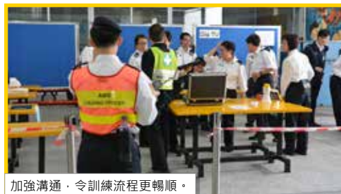
加強溝通，令訓練流程更暢順。