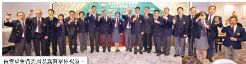
長官聯會各委員及嘉賓舉杯祝酒。