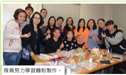
隊員努力學習麵粉製作。