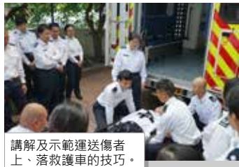
講解及示範運送傷者上、落救護車的技巧。