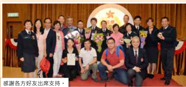
感謝各方好友出席支持。