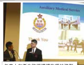
年青人向衛生防護課指揮林建群醫生（右一）請教本隊大型行動。