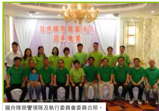
龍舟隊榮譽領隊及執行委員會委員合照。