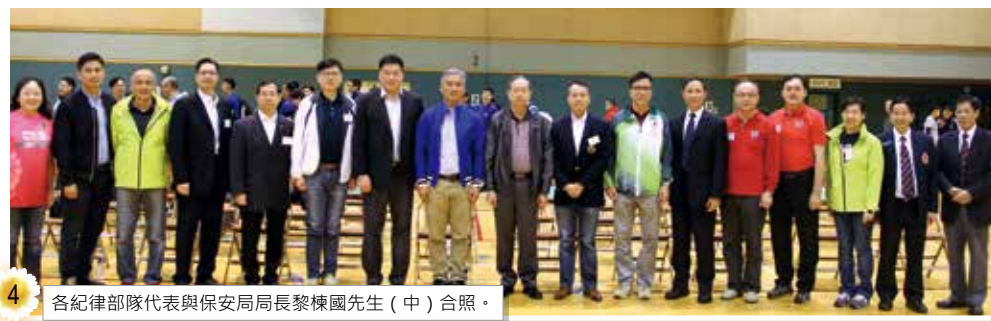
各紀律部隊代表與保安局局長黎棟國先生（中）合照。