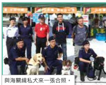
與海關緝私犬來一張合照。