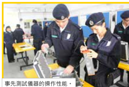
事先測試儀器的操作性能。