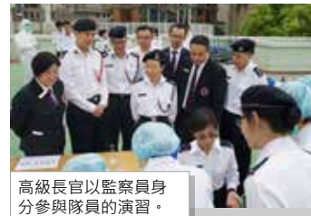
高級長官以監察員身分參與隊員的演習。