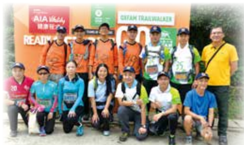
參加毅行者的隊員與嘉賓合照。

各位參加者不但須要籌到一定善款外，還要身體力行走畢全程100公里，他們的努力，實是我們學習的大好機會。