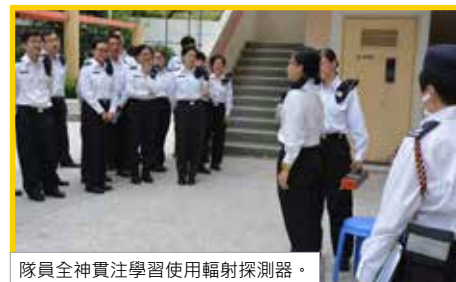
隊員全神貫注學習使用輻射探測器。