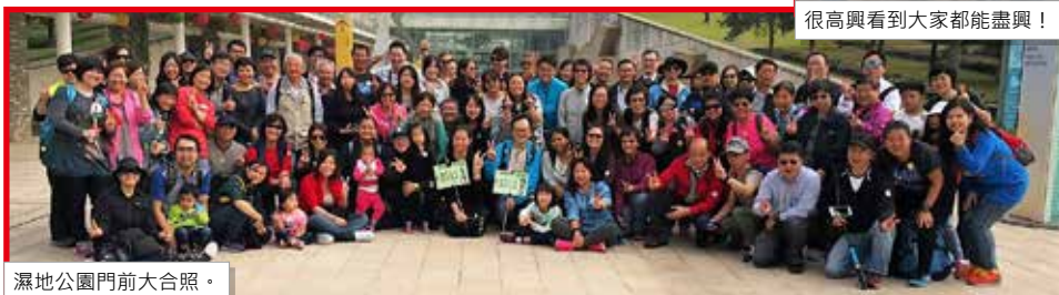
濕地公園門前大合照。