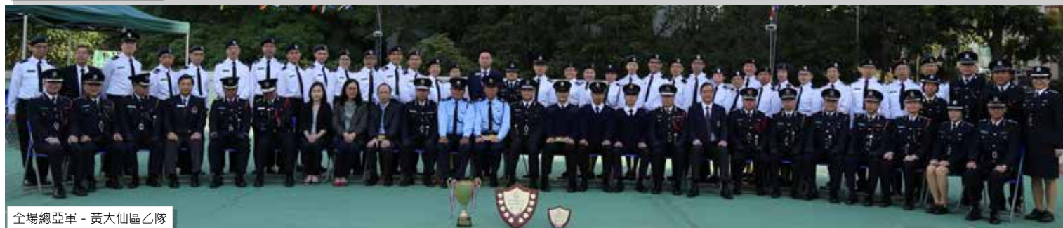
全場總亞軍 - 黃大仙區乙隊