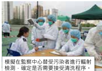
模擬在監察中心替受污染者進行輻射檢測，確定是否需要接受清洗程序。