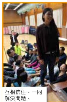
互相信任，一同解決問題。