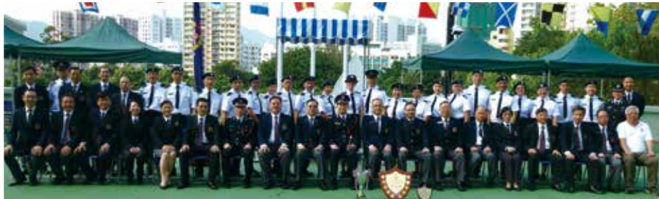
新界東總區比賽全場總冠軍 (大埔區甲隊) (15.5.2016)