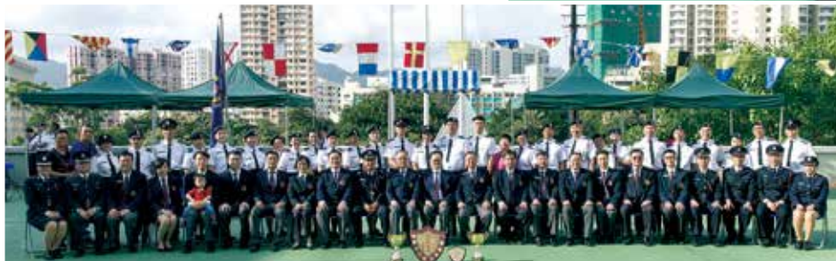
香港總區比賽全場總冠軍 (南區甲隊) (29.5.2016)