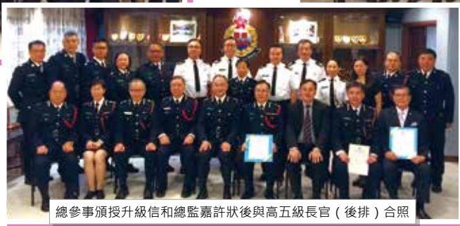
總參事頒授升級信和總監嘉許狀後與高五級長官（後排）合照