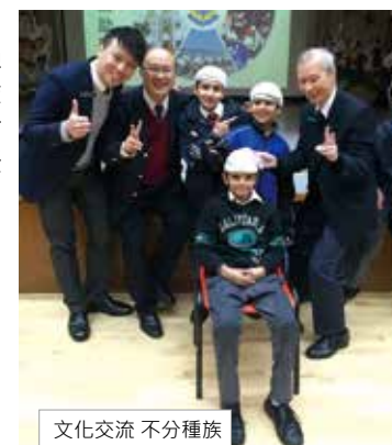
文化交流 不分種族

醫療輔助隊少年團已邁向五周年，現時團員數目已超過1800人。少年團行政及人力發展科藉着宣傳及推廣、招募活動，不斷拓展文化交流，凝聚團隊精神，為少年團奠定燦爛的里程碑。