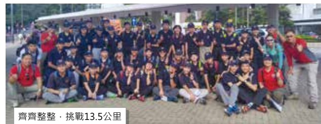
齊齊整整，挑戰13.5公里

這五年多的少年團生活，我看見的是有主見、有思想、有堅持的好孩子。誰說香港孩子是港童？