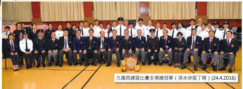
九龍西總區比賽全場總冠軍 (深水埗區丁隊) (24.4.2016)