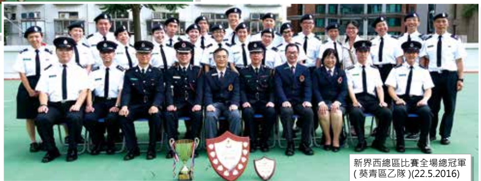
新界西總區比賽全場總冠軍 (葵青區乙隊) (22.5.2016)