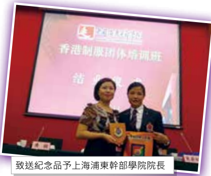
致送紀念品予上海浦東幹部學院院長