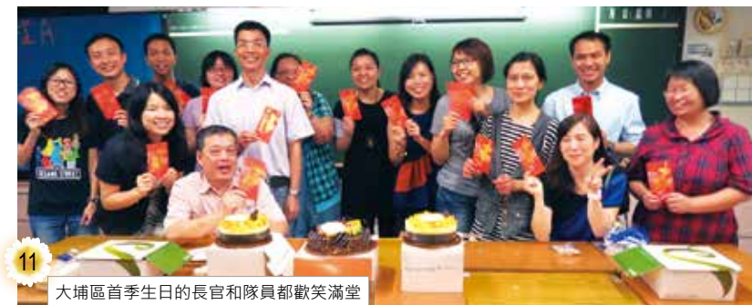
大埔區首季生日的長官和隊員都歡笑滿堂

為慰勞默默耕耘無私奉獻的隊員，今年六月八日大埔區首次為四至六月出生的隊員舉行了季度生日聯歡會，同時亦頒發小禮物與去年底周年複試考獲優異的四十名長官和隊員，以作鼓勵。更為本區甲隊剛在今年新界東總區比賽取得災難醫療分項冠軍及全場總冠軍、丙隊又取得問答分項冠軍及全場總亞軍祝捷而作出表揚。除與會長官隊員都喜氣洋洋，連剛派落本區的九位新隊員也能感受箇中歡樂和榮譽，也分享了這年來大家努力付出的成果。