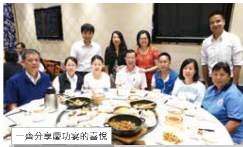
一齊分享慶功宴的喜悅