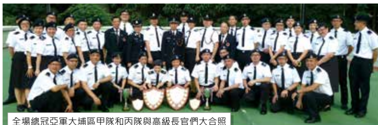
全場總冠軍大埔區甲隊和丙隊與高級長官們大合照