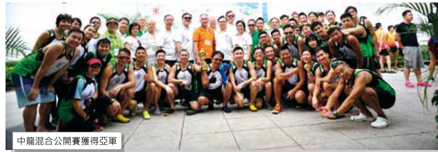
中龍混合公開賽獲得亞軍