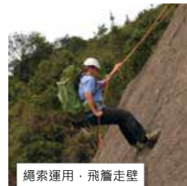
繩索運用，飛簷走壁

課程除了對技術要求嚴格外，對學員的體能要求也很高，每一次戶外遠足露營實習也要背著40至50磅的裝備同行，四次的實習課，我們遇到過33度高溫，遇到過風雨飄搖，也遇到過結霜冰雹的日子，為著少年團的未來發展和訓練，我們也一一克服了，但訓練並未完，我們還有很多需要學習的地方，多艱辛也要向前行！