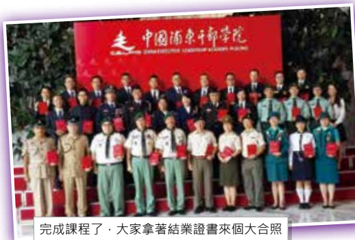
完成課程了，大家拿著結業證書來個大合照

上海中國浦東幹部學院舉辦的香港制服團體培訓班，剛於在 7/7/2016 - 13/7/2016 完成，是次課程共有14個制服團體共派出36人參加，本人有幸代表醫療輔助隊參與訓練。七天的培訓課程包括『滬港經濟合作前景展望與上海自貿區建設』、『香港政制發展歷程』、『我國周邊形勢與國家安全』、『屈辱中的奮起 - 中國共產黨發展史』、『國學智慧與現代管理』和『一帶一路戰略與上海自貿試驗區的建設』。感謝香港中聯辦的安排，使各學員在舒適的環境下能完成學習，讓學員對國家多一點認識，小一點誤解。