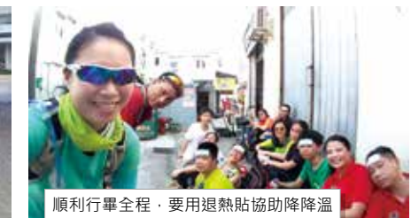
順利行畢全程，要用退熱貼協助降降温