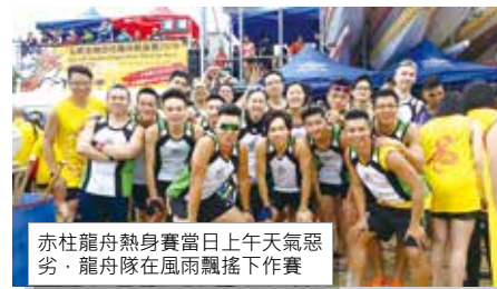
赤柱龍舟熱身賽當日上午天氣惡劣，龍舟隊在風雨飄搖下作賽