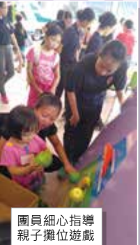
團員細心指導親子攤位遊戲