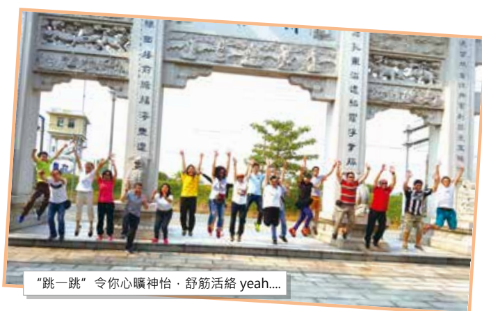
「跳一跳」令你心曠神怡，舒筋活絡 yeah....