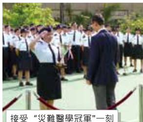
接受“災難醫學冠軍”一刻

隊長的話：事隔三年再奪得“全場總冠軍”，並初嘗“災難醫學冠軍”，有賴各位隊友比賽前的不斷練習、努力和付出，以及長官和DMAI的悉心指導，同心協力，表現出大埔區「專業、專注、實力的保證」，大家繼續努力，加油！