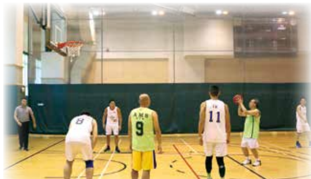
投籃一刻，聚精會神