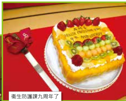
衛生防護課九周年了