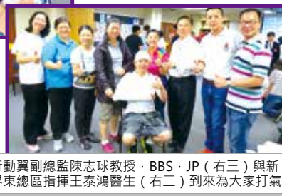
行動翼副總監陳志球教授、BBS、JP（右三）與新界東總區指揮王泰鴻醫生（右二）到來為大家打氣