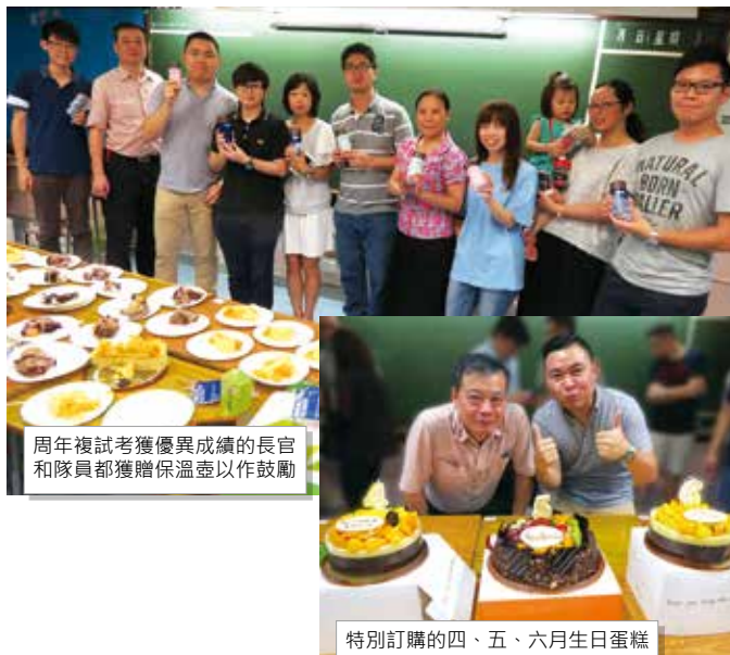
周年複試考獲優異成績的長官和隊員都獲贈保溫壺以作鼓勵