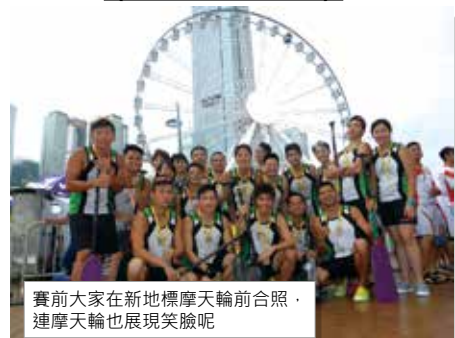
賽前大家在新地標摩天輪前合照，連摩天輪也展現笑臉呢