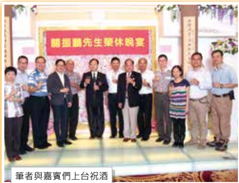
筆者與嘉賓們上台祝酒