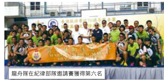
龍舟隊在紀律部隊邀請賽獲得第六名