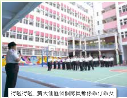
得咗得咗...黃大仙區個個隊員都係乖仔乖女

時光飛逝，我們黃大仙區上下祝願林長官好好享受退休生活，在寶貴的銀髮生活繼續綻放光芒。