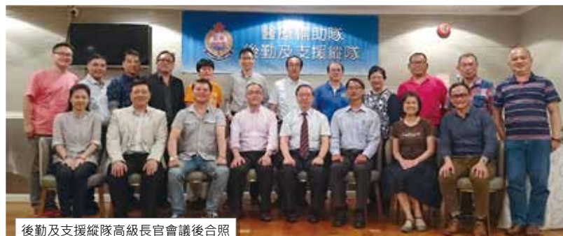
後勤及支援縱隊高級長官會議後合照