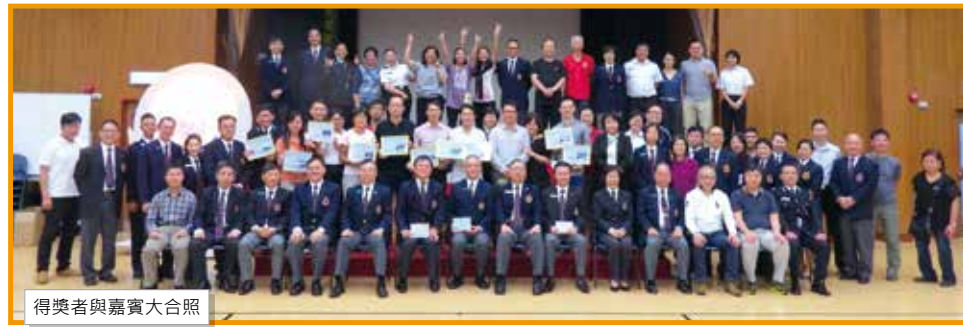
得獎者與嘉賓大合照