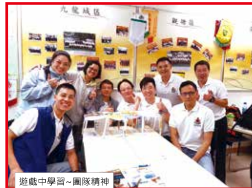
遊戲中學習~團隊精神