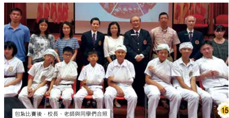
包紮比賽後，校長、老師與同學們合照