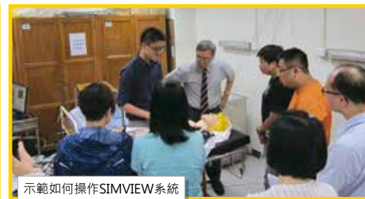
示範如何操作SIMVIEW系統