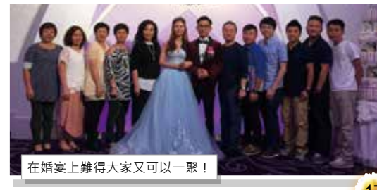
在婚宴上難得大家又可以一聚！