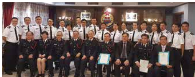
總參事頒授升級信和總監嘉許狀後與五級長官（後排）合照