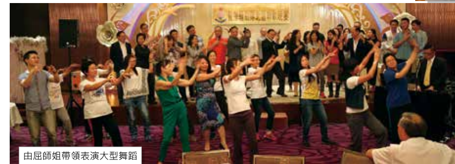
由屈師姐帶領表演大型舞蹈