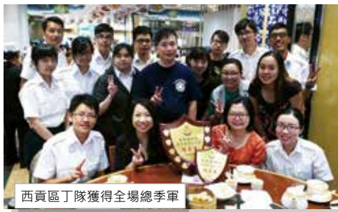
西貢區丁隊獲得全場總季軍

為讚揚西貢區所有長官及隊員努力成果的表現，在六月五日訓練日完結後，在將軍澳舉辦周年比賽慶功宴。當日更邀請其他長官嘉賓一齊來臨分享這份喜悅，西貢區所有隊友來年會繼續努力！爭取更好成績！