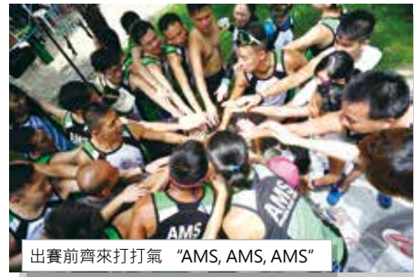
出賽前齊來打打氣“AMS, AMS, AMS”