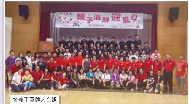
各義工團體大合照

少年團九龍地域協助東九龍獅子會、香港單親家庭協會及扶弱紓困協會舉辦《親子海鮮迎夏日》，目的是招待一百個單親家庭，共200人享用一個豐富及歡樂的海鮮晚宴。活動共分了為個部份，第一部份少年團安排了攤位及團體遊戲給各參加活動的孩子，第二部份由東九龍獅子會提供食物材料，並派出義務廚師聯同少年團的導師一同烹調海鮮晚宴。團員除了協助招待各參加家庭外，也安排了歌舞表演。少年團的顧問基金亦撥出五千多元購買文具禮品送給各參加的孩子們。點點關愛希望能得以延續，發光發熱。