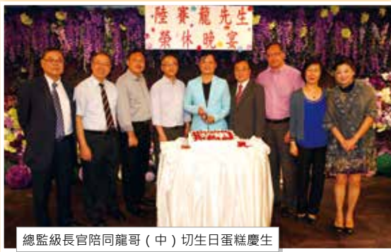
總監級長官陪同龍哥（中）切生日蛋糕慶生