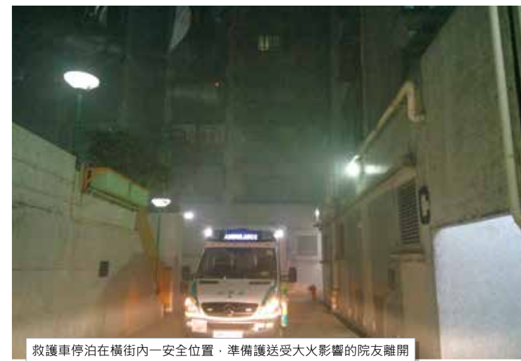
救護車停泊在橫街內一安全位置，準備護送受大火影響的院友離開