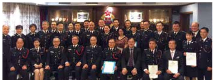
總參事頒授升級信和總監嘉許狀後與六級及以上長官合照