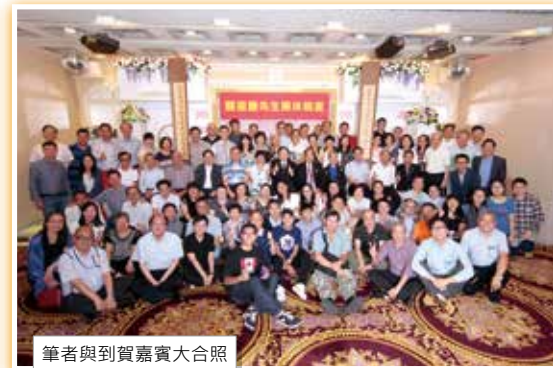
筆者與到賀嘉賓大合照