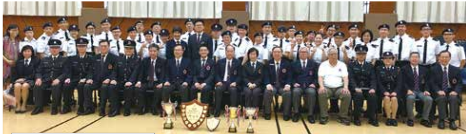
九龍東總區比賽全場冠軍隊 (黃大仙區乙隊) (17.4.2016)