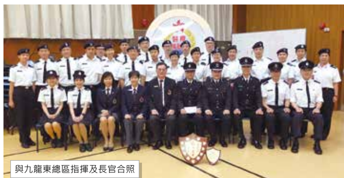
與九龍東總區指揮及長官合照