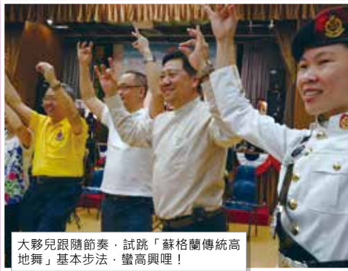
大夥兒跟隨節奏，試跳「蘇格蘭傳統高地舞」基本步法，蠻高興哩！