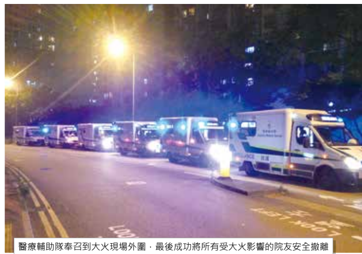
醫療輔助隊奉召到大火現場外圍，最後成功將所有受大火影響的院友安全撤離

2016年6月21日，牛頭角淘大工業村迷你貨倉發生四級火警，是次意外導致2名消防員殉職及12名消防員受傷。運輸組於22日晚上，收到醫療輔助隊總部緊急指示，回應消防處要求，派遣司機駕駛救護車，協助將一間位於得寶花園受大火影響的護老院院友護送至安全地方暫避。運輸組當晚派遣8部救護車，聯同約50名隊員，攜手與其他政府部門合作，成功將所有院友安全撤離。其後醫療輔助隊亦派隊員進駐於社區中心提供急救服務以及在總部候命，以應付突發事故。