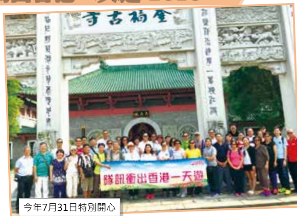
今年7月31日特別開心