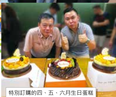
特別訂購的四、五、六月生日蛋糕