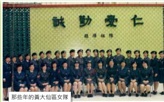
那些年的黃大仙區女隊