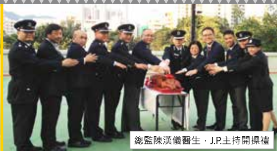
總監陳漢儀醫生，J.P.主持開操禮

每年九月，衛生防護課各醫生、護士、長官及隊員都為開操檢閱禮顯得十分雀躍，齊集一起加緊步操訓練。得到總監陳漢儀醫生，J.P. 及各級長官來臨主持開操禮，他們的支持及鼓勵大大增強了衛生防護課的團隊精神。