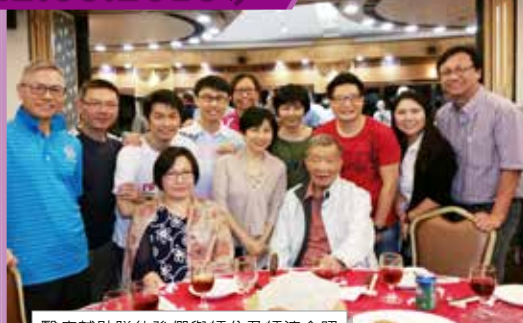
醫療輔助隊徒弟們與師公及師婆合照