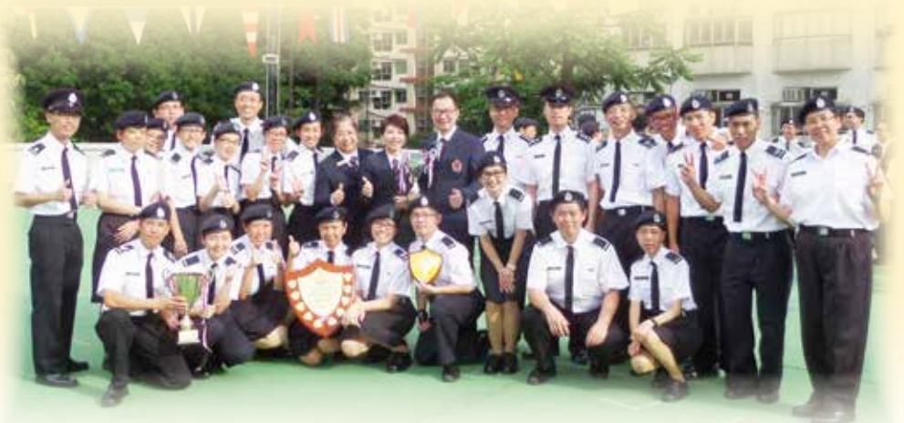
全場總冠軍 - 葵青區乙隊

大家都保持平時加操練習的心情，憑著全力以赴的意志，完成一個又一個的比賽環節。在宣佈結果的那一刻，隊員都感到十分意外及驚喜，眼淚在眼眶打轉，大家都心知結果得來不易。這次的全場總冠軍，肯定了我們葵青區乙隊一直以來團隊精神和加練的成果。