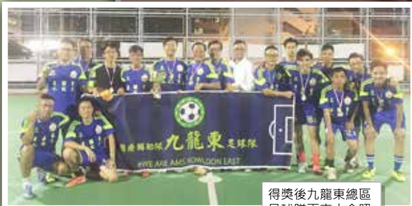
得獎後九龍東總區 足球隊再來大合照