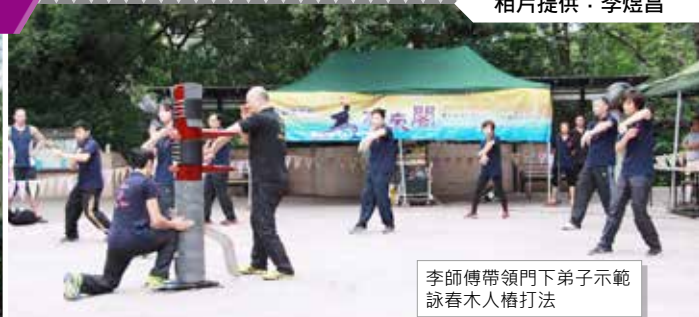
李師傅帶領門下弟子示範詠春木人樁打法