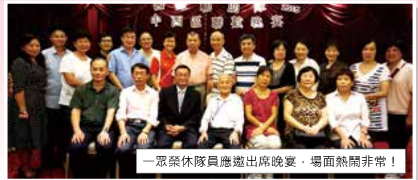
一眾榮休隊員應邀出席晚宴，場面熱鬧非常！