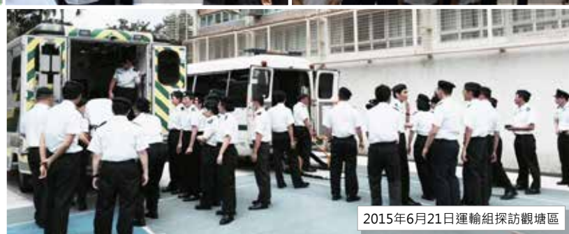
2015年6月21日運輸組探訪觀塘區

運輸組在2015年6月至9月期間，先後探訪觀塘區、東區、九龍城區、荃灣區、沙田區和南區，分別與各區隊員一同研習，分享使用救護車裝備心得。我們會於較後時間，繼續探訪其他區份／單位，與隊員們交流使用救護車裝備的技巧。