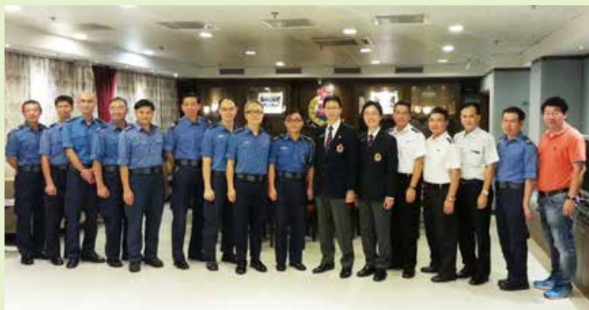
醫療輔助隊運輸組與民安隊運輸中隊於長官會所合照