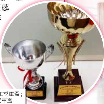
左: DRUM BATTLE季軍盃； 右: DRUM LINE冠軍盃

樂隊鼓樂組剛於七月十八日參加了第五屆敲擊及步操樂團比賽，我們的敲擊樂手張佩華和五位隊友在大家的鼓勵下，再下一城，勇奪DRUM LINE冠軍及DRUM BATTLE季軍盃，在此恭賀得獎的隊友！同時要感謝堅持不懈的音樂導師的悉心指導，甚願大家來年成績更上一層樓。