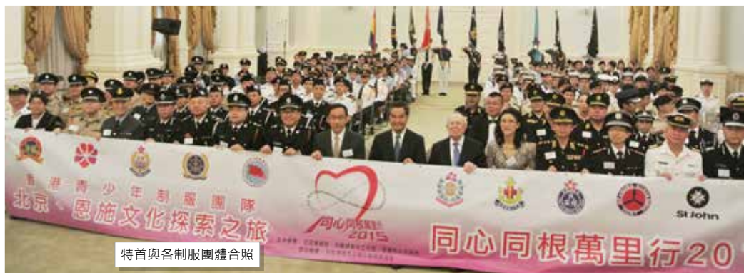
特首與各制服團體合照

李博士在致辭中說，『同心同根萬里行』活動自2002年舉辦以來，組織本港青少年代表赴內地參觀訪問，致力於增進同內地青少年的友誼，加深本港青少年對國家各方面的認識，增強民族觀念以及對國家的認同感，為促進香港同內地的友好往來及良性互動作出積極貢獻。他希望本港青少年能夠藉此機會，開拓視野，瞭解祖國內地最新的發展情況，為未來的個人發展打下良好基礎。