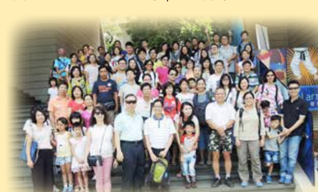
3D藝術館所影的大合照

屯門區一年一度的暑假旅行在8月份舉行，今年節目非常豐富，首站往參觀3D藝術館，中午前往尖沙咀某酒店享用自助餐，尾站往中環主題公園SUPER SUMMER遊樂；盡興而歸。