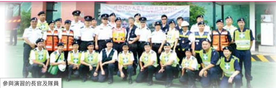
參與演習的長官及隊員