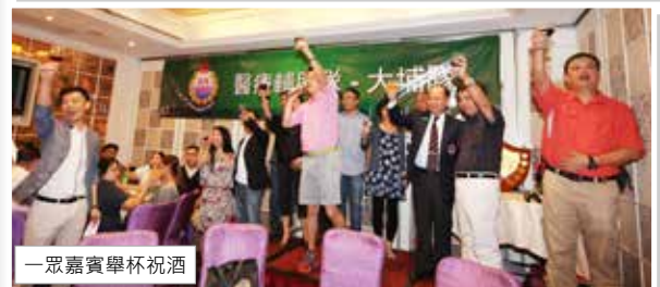
一眾嘉賓舉杯祝酒