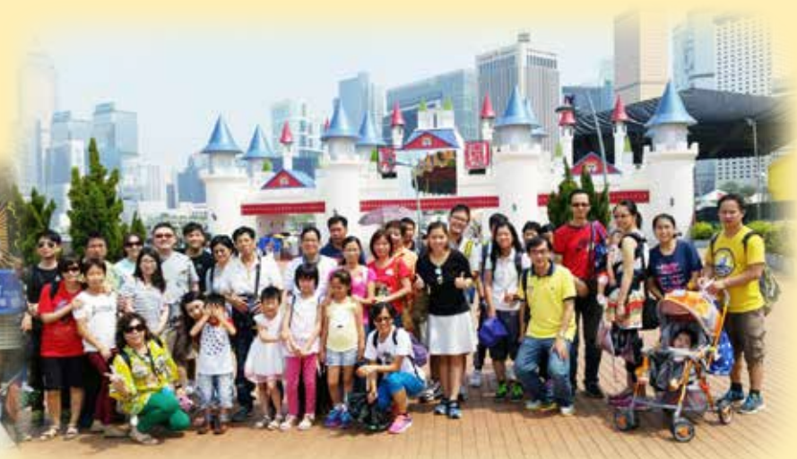
主題公園門前的大合照