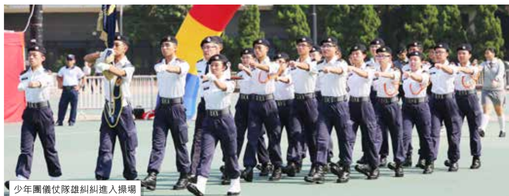
少年團儀仗隊雄糾進入操場