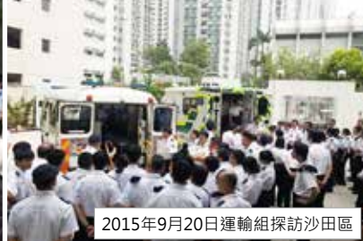
2015年9月20日運輸組探訪沙田區