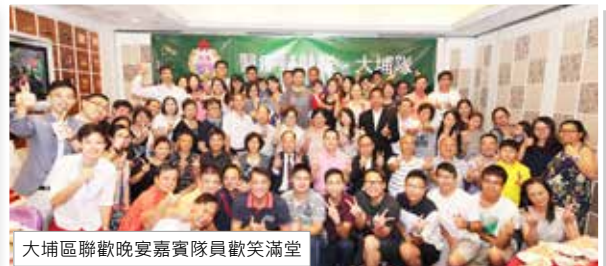
大埔區聯歡晚宴嘉賓隊員歡笑滿堂