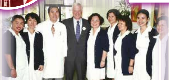
攝於柏立基美沙酮診所，正 值前港督彭定康到訪(1995)