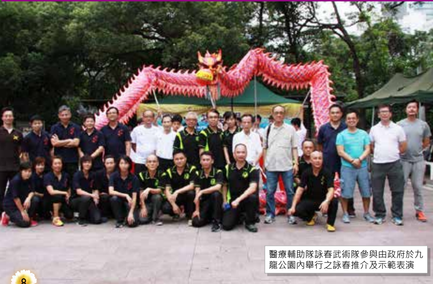
醫療輔助隊詠春武術隊參與由政府於九龍公園內舉行之詠春推介及示範表演