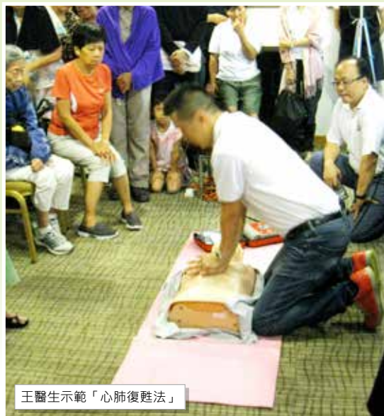
王醫生示範「心肺復甦法」

醫療輔助隊義工團外展健康教育組於2015年7月4日，舉辦了「社區心肺復甦法」講座和訓練，藉此市民如何處理心臟停頓患者。