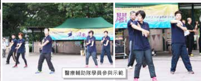
醫療輔助隊學員參與示範