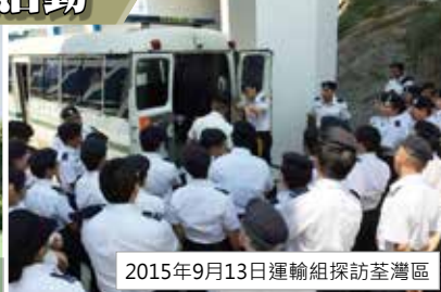
2015年9月13日運輸組探訪荃灣區