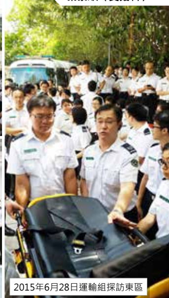
2015年6月28日運輸組探訪東區

運輸組在2015年6月至9月期間，先後探訪觀塘區、東區、九龍城區、荃灣區、沙田區和南區，分別與各區隊員一同研習，分享使用救護車裝備心得。我們會於較後時間，繼續探訪其他區份／單位，與隊員們交流使用救護車裝備的技巧。