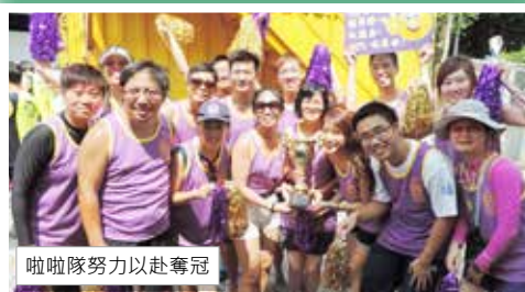
啦啦隊努力以赴奪冠

是次龍舟及啦啦隊特訓再次給予衛生防護課各醫生、護士、長官及隊員一起學習的好機會，教練透過六堂龍舟訓練，迅速提高隊員的個人體能來應付比賽。