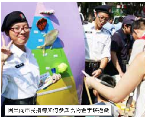
團員向市民指導如何參與食物金字塔遊戲