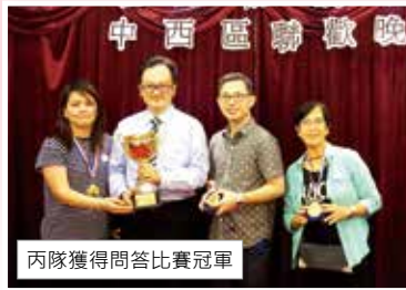
丙隊獲得問答比賽冠軍