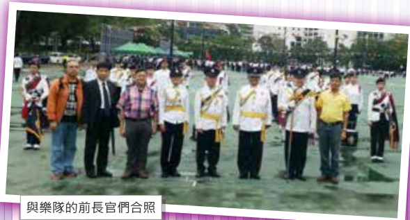
與樂隊的前長官們合照

2015年10月11是總監會操的大日子，雖有秋雨沁涼，但無損大家的熱情，曾為樂隊奉獻多年的前長官們都冒雨到來見證兩年一度的總監閱操盛事。