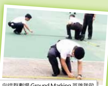
向這群劃場 Ground Marking 英雄致敬

大家可知道每逢有任何大小區慶檢閱、每年總區周年比賽、每次新班結業會操、及每兩年一度的總監會操，步操組導師就是最忙碌的一群。就像今年2015總監會操為例，清晨六時半，30多位步操導師已經到達維園4至6號足球場，有系統地分成3組作了精簡的簡介會後，便馬上開始劃場工作，務必在8時前準時交場予大會進行最後綵排。