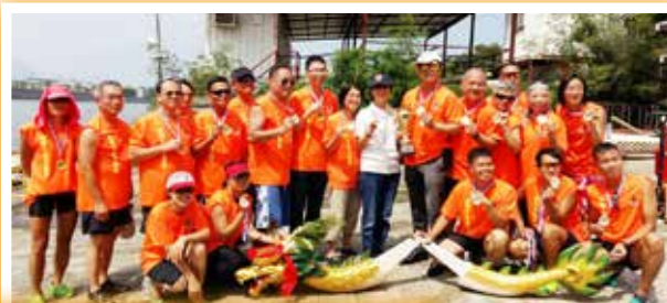
後勤及支援隊龍舟隊力壓群雄，銳不可擋，勇奪「醫療輔助隊65周年龍舟挑戰賽建豐杯」冠軍