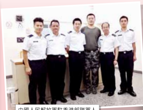
中國人民解放軍駐香港部隊軍人與醫療輔助隊醫生和隊員合照

醫療輔助隊也成為當值的一份子，廿四小時為學員提供醫療和急救服務，晚上更有醫生為學員診症；非常感謝一群盡心盡力當值的醫生、護士、長官和隊員們。