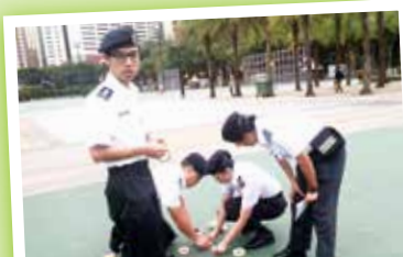
大部份步操導師來自不同區隊，像是另一個大家庭，大家樂在其中，群策群力。