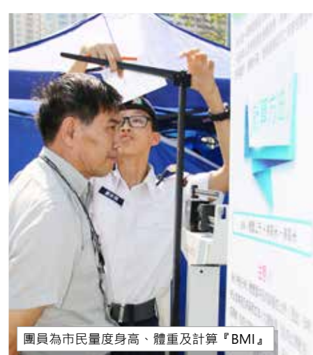
團員為市民量度身高、體重及計算『BMI』