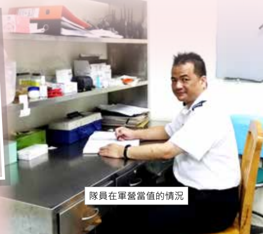
隊員在軍營當值的情況