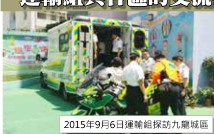
2015年9月6日運輸組探訪九龍城區