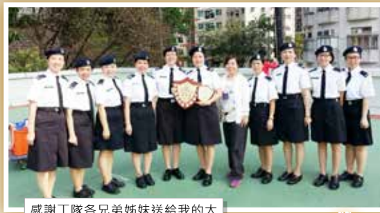
感謝丁隊各兄弟姊妹送給我的大 禮——2015年九龍東總區季軍