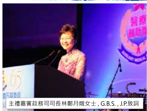
主禮嘉賓政務司司長林鄭月娥女士, G.B.S., J.P.致詞