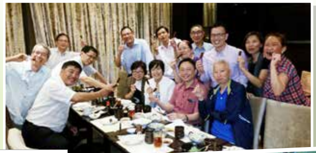
周年紀念聚會，品嘗飯後甜點

「十年寒窗」不易，要在醫療輔助隊團結一撮志同道合的隊員逾二十五載，相信常人都知道艱辛，本隊第一屆準長官訓練班Officer Cadet Course（OC1）於1989年第四季展開，學員來自各分區，學員趨新，頗能虛心受教。顯然地，各人初循正軌，邀師長作點評，與同窗共討論。時光靜好，25歲月恍然，難得各同學們仍能抽空聚首一堂，藉此話說當年。這二十五年，算是非常精彩無悔。