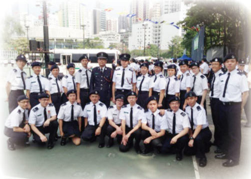
▲兩年一度的總監會操（北區隊伍）

每年的毅行者比賽，北區隊員都會被派駐畢架山山頂的五號檢查站，與醫管局醫護人員合作為參賽者提供急救及護理服務。大多數前來求助的參賽者，都是需要膝蓋包紮、大小腿抽筋及處理水泡等；醫護人員亦會準備一些藥物給與有需要的參賽者。見到他們充滿毅力的精神向終點邁進，各駐站工作人員都給予掌聲支持。