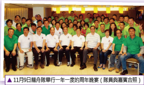
▲ 11月9日龍舟隊舉行一年一度之周年晚宴 (隊員與嘉賓合照)