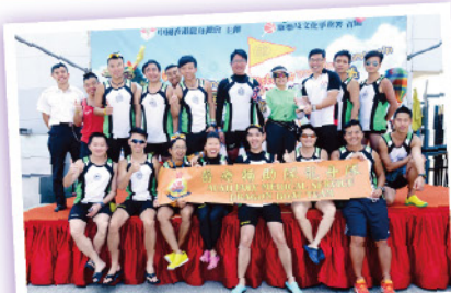
▲ 10月20日第四屆香港長途龍舟錦標賽小龍公開組亞軍

這些豐碩的成果並非一朝一夕間即可獲得，在過去的兩個年頭，舊隊員固然投入大量的精神和努力，新加入的成員亦須要教練的悉心指導和積極參與練習才能與其他隊員配合並在比賽中發揮實力。