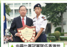
▲步操比賽冠軍隊伍香港地域第一中隊甲乙聯隊代表