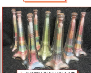
▲多美麗的彩色沙樽制成品