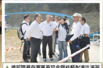
▲總部職員與嘉賓長官參觀核輻射清洗演習