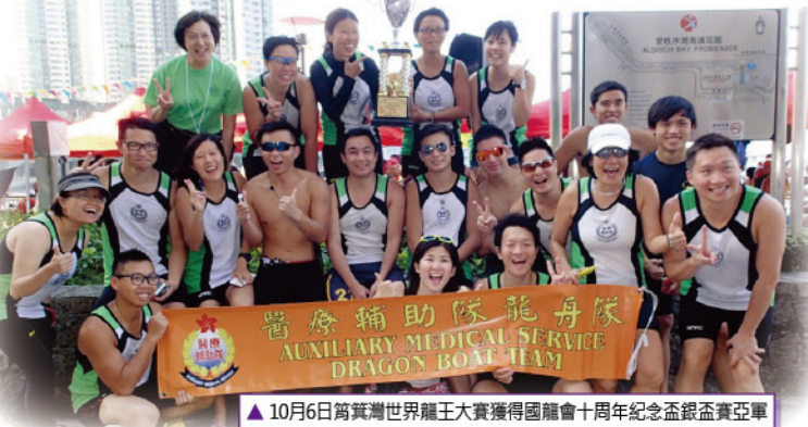
▲ 10月6日筲箕灣世界龍王大賽獲得國龍會十周年紀念盃銀盃賽亞軍

隊員間除正職以外除要為所屬隊伍提供服務、在如此繁重的工作之餘仍能兼顧到龍舟隊的練習，相信亦是十分值得鼓勵的。而每年龍舟隊的周年晚宴正正為隊員提供機會能夠暫時放下練習暢快地與其他隊友，長官共慶的大好日子，但願龍舟隊在下一年度能夠繼續為部隊發熱發光，爭取美滿的成績。