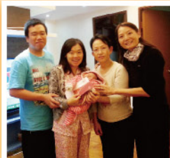
▲ 送上少少賀禮，蘇爸爸笑到見牙唔見眼。