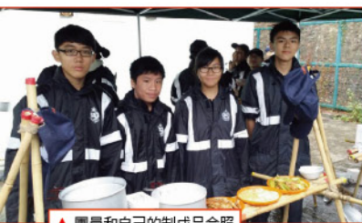
▲團員和自己的制成品合照

少年團九龍地域第一中隊於剛過去的農曆新年期間舉行一個兩日一夜訓練營，訓練營的主題為野外烹飪和天文觀星。烹飪的目的是希望團員能掌握烹飪技巧，用意增強他們烹飪的信心和了解烹飪的樂趣，並且訓練和組員之間的合作性；天文觀星項目更是讓他們了解環保的重要性，今天香港光污染嚴重，能仰天看星已不是易事，遺憾的是天公不造美，活動當晚天氣不好，下雨及雲層太厚，所以未能成功利用天文望遠鏡觀星，但香港大學天文學會的導師依然一行十四，帶備了電腦及天文觀星重裝備，利用有限的環境為團員講解，內容趣味性極高，兩個多小時沒有一刻冷場。希望下一次能觀星成功，在此再多謝香港大學天文學會的導師帶給團員趣味的一課。