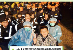
▲天才表演榮獲最佳服飾獎