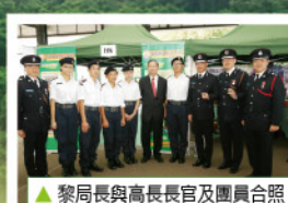
▲黎局長與高長官及團員合照