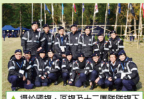
▲攝於國旗、區旗及十二團隊隊旗下

團體生活使我們學習到『遷就』，晚上要等了很久才能洗澡，早上為了不與別人爭水喉梳洗而和日出門早起，種種回憶，十分難忘深刻。更令我明白到平日身在福中不知福的我，『家』有多溫暖。令我們更珍惜有家！