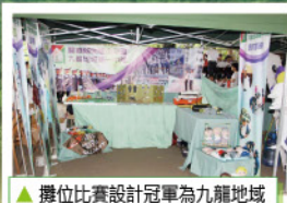
▲攤位比賽設計冠軍為九龍地域第一中隊，圖為得獎作品