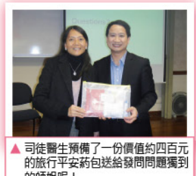
▲ 司徒醫生預備了一份價值約四百元的旅行平安藥包送給發問問題獨到的師姐呢！