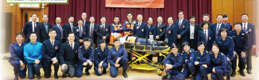
▲ 救援示範隊員與來賓合照