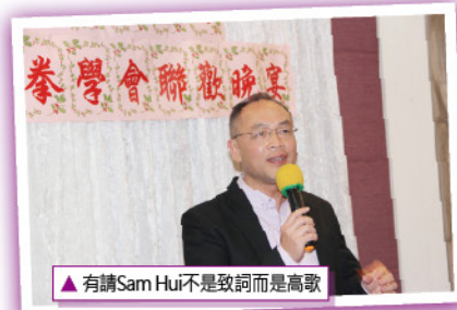
▲ 有請Sam Hui不是致詞而是高歌