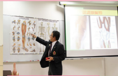
▲講者：歐陽名軒先生（荃灣區顧問長官）