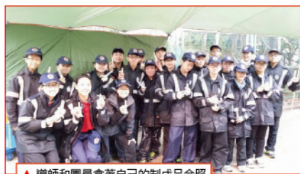
▲導師和團員拿著自己的制成品合照