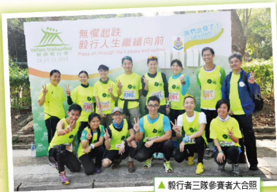
▲毅行者三隊參賽者大合照