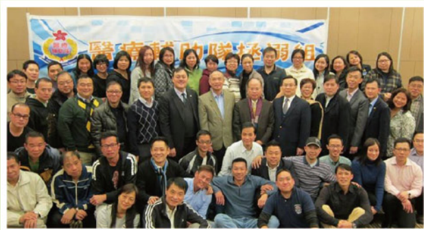
撰文：周靄澄 (龍舟隊執委委員)

承蒙厚愛，去年所有游泳訓練、教練或準教練培訓班、先修及提升課程；以及晚宴開支都由澤心仁厚的名譽顧問們支持惠澤。此外，亦向長官聯會致謝，醫療輔助隊救生員當值服飾，以及拯溺訓練中，部分裝備都由長官聯會贊助支持，促使拯溺組穩健發展，前線人員獲充裕支援。