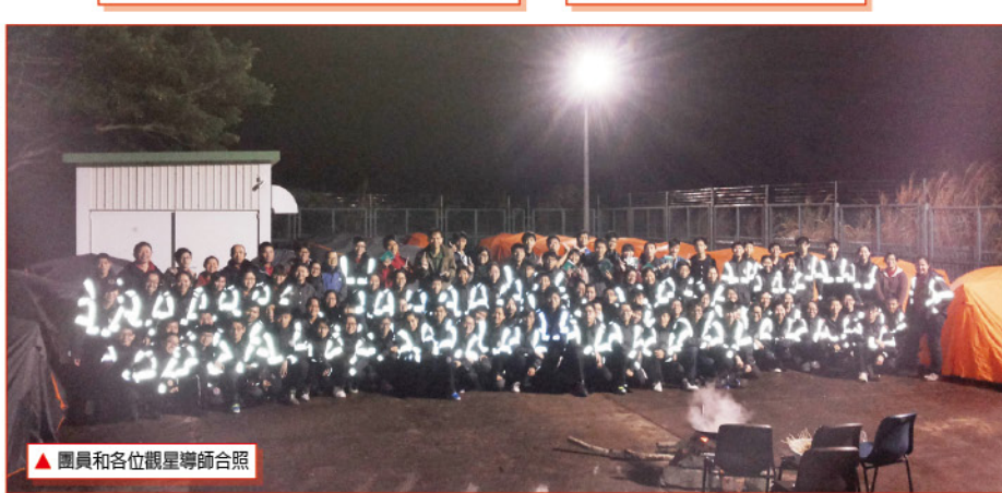
▲團員和各位觀星導師合照