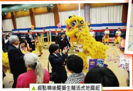
▲ 經點睛後醒獅生龍活虎地躍起