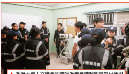
▲香港大學天文學會的導師為團員講解觀星器材使用