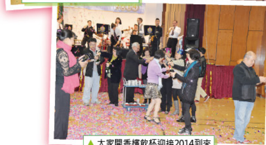
▲ 大家開香檳飲杯迎接2014到來