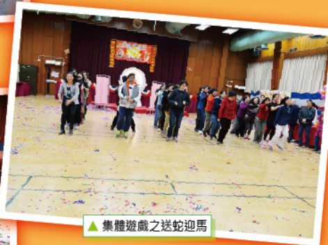
▲ 集體遊戲之送蛇迎馬