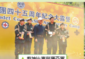
▲廚神比賽榮獲冠軍