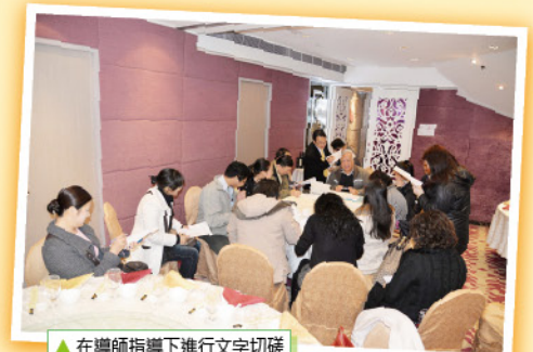
▲在導師指導下進行文字切磋