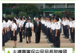
▲主禮嘉賓保安局局長黎棟國先生進行檢閱