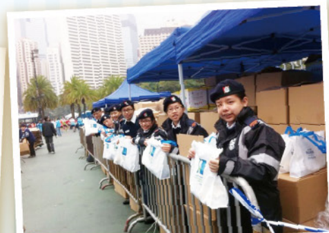
▲少年團協助派發物品予跑手