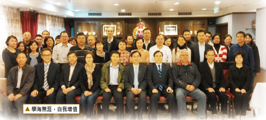
▲ 學海無涯，自我增值

是次技術及經驗交流會讓我們擴闊視野，救急扶危除了是即時的生命拯救外，協助傷困重過新生、如何減災亦是重要的一環；更讓大家明白到香港確實是一片福地，施比受更為有福！就讓作為醫療輔助隊一員的我們，繼續為社會多發一點熱和光。