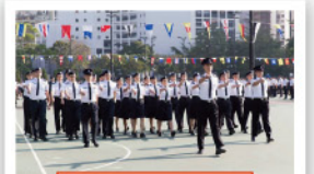
▲九龍城區經過檢閱台