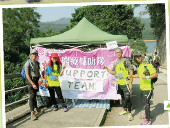
▲參賽者到達支援站