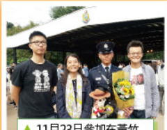
▲ 11月23日參加在黃竹坑警校的結業運操典禮