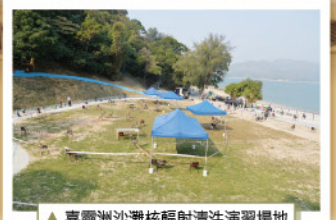
▲喜靈洲沙灘核輻射清洗演習場地