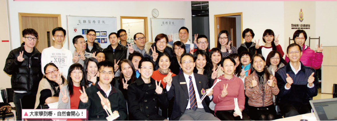
▲大家學到嘢，自然會開心！