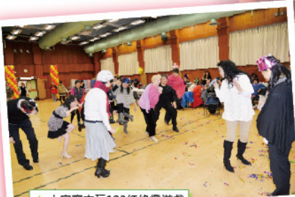
▲ 大家齊來玩123紅綠燈遊戲