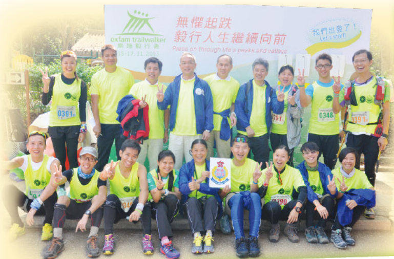
▲三隊參賽者與CSO合照