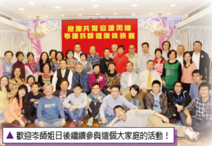
▲歡迎岑師姐日後繼續參與這個大家庭的活動！