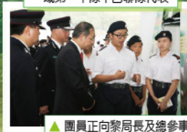
▲團員正向黎局長及總參事介紹攤位內容