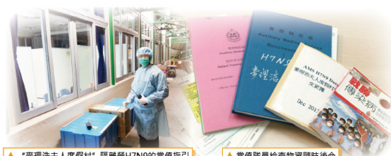
▲ “麥理浩夫人度假村” 隔離營H7N9的當值指引

到了第二天中午時分，突然收到隊長通知，本區接手負責今次H7N9“麥理浩夫人度假村”被徵用為臨時隔離營的緊急當值任務。為配合24小時運作，當值時間分為早、中、夜3更。每名隊員收到此緊急召喚後，沒有擔心受到感染的機會而拒絕應更，反而第一時間更加積極地報名。大家都深信平時訓練有素、累積相關的豐富經驗及佩帶安全的裝備，一定能夠協助有需要的人士。到達“麥理浩夫人度假村”後，我們就根據總部帶來的指引，開始執行當值。由召集隊員至物資安排一切都很順利！此外，還可與衛生署、警務處、民眾安全服務隊等...相關部門合作使我們獲益良多。最後希望患者早日康復，而每名醫療輔助隊隊員，會繼續維持發揮隨時後命服務市民的精神！