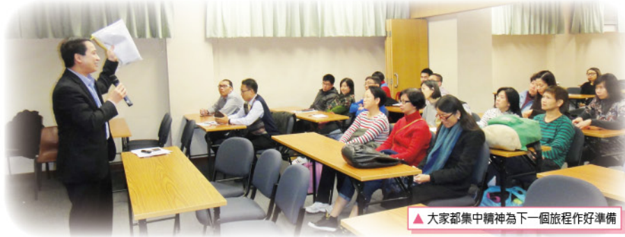
▲ 大家都集中精神為下一個旅程作好準備