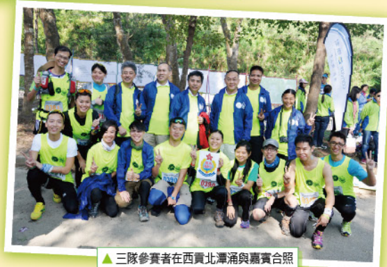
▲三隊參賽者在西貢北潭涌與嘉賓合照