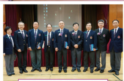
▲ 應急特遣隊指揮、副指揮與來賓合照