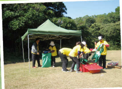
▲黃組隊員挑戰在有限時間內設立急救站