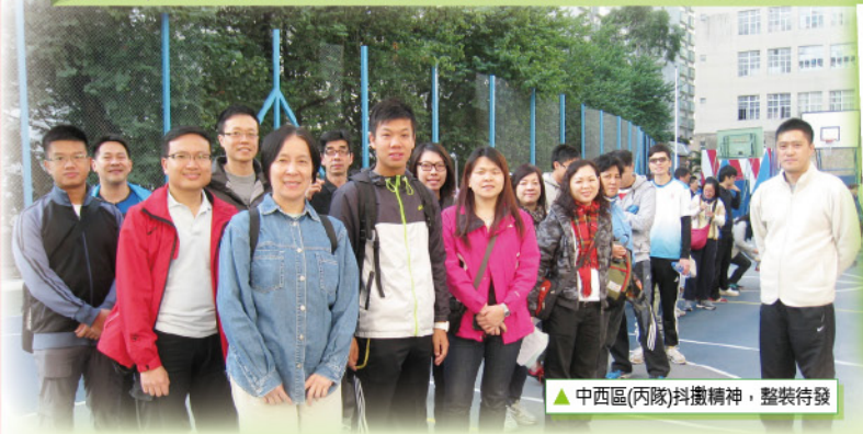
▲中西區(丙隊)抖擻精神，整裝待發