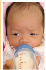
▲ 蛇B取名子晉，健康可愛。