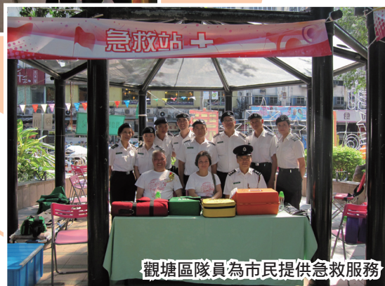
觀塘區隊員為市民提供急救服務

當日主持開步禮嘉賓 （左一）筆者 （左二）觀塘區議會主席陳振彬太平紳士BBS （右一）署理觀塘民政事務專員徐耀良先生 （右二）中央人民政府駐香港特別行政區聯絡辦公室九龍工作部副部長余汝文先生