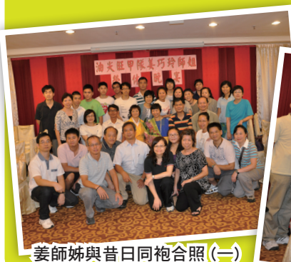
姜師姊與昔日同袍合照(一)