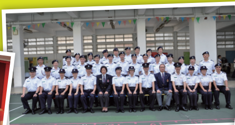
油尖旺甲隊大合照