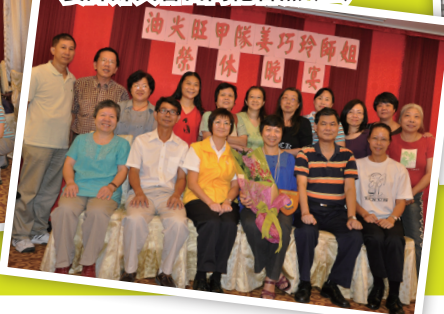
姜師姊與昔日同袍合照(三)