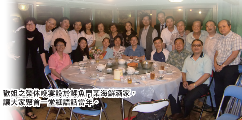
歡姐之榮休晚宴設於鯉魚門某海鮮酒家，讓大家聚首一堂細語話當年。