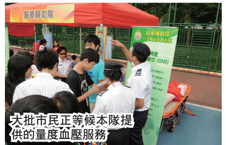
大批市民正等候本隊提供的量度血壓服務