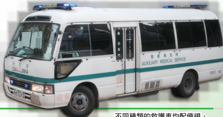
不同種類的救護車均配備視、聽警告設備。