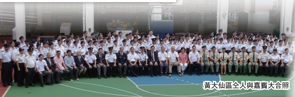
黃大仙區全人與嘉賓大合照