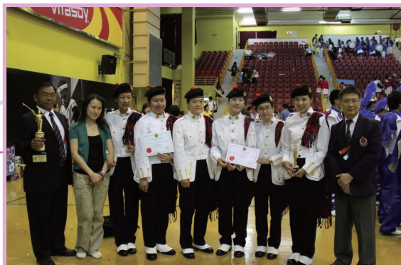
長官們到比賽場地(灣仔修頓中心)祝賀健兒們的驕人成績。

本隊鼓樂隊眾鼓手在去年的「香港步操樂隊節」贏得「鼓王盃總冠軍」及「鼓組金獎」。繼往開來，二零一零年的風笛鼓組和鼓樂興趣組的隊員又再奪得「敲擊樂金獎」和「最佳技巧獎」，成績著實令人鼓舞，也意味著「天道酬勤」必成正果。不枉他們曾付出無限的私人時間，不辭勞苦，專心致志練習軍鼓藝術。最特別不過的事是次全隊六位均為女隊員，並將獎盃捧回來，取得其他參賽隊伍長處之餘，更加强了隊友間之合作和技術，與各友隊關係更為密切、更互相交流心得。但願大家能再接再勵，精益求精，不斷為醫療輔助隊贏得更多美譽！