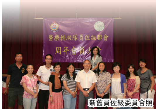
新舊員佐級委員合照