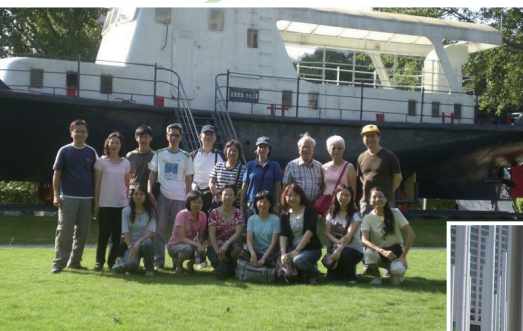
1+2 攝於中山岐江造船公園（公園前身是粵中造船廠，保留了五六十年代中山市工業時代的歷史面貌，加入現代設計之理念，成為中山第一個特式公園）

“食”～ 首選五邑名菜十八式，搜羅江門五邑地區十八款名菜，一嚐屬於僑鄉本土小菜，如：陳皮金銀鴨湯、翡翠鱸片煲仔飯、白灼鮮味東江蝦……令大家吃得應接不暇。