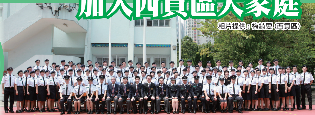
西貢區各成員大合照