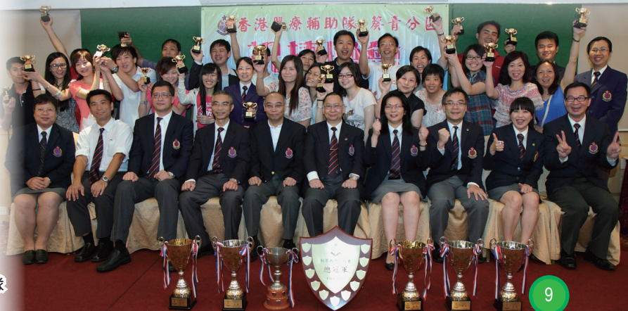
新界西總區比賽冠軍隊 - 葵青乙隊

為慶祝葵青區本年度周年比賽屢獲佳績，各隊於7月4日晚上假海關總部舉行了分區祝捷晚會。當晚氣氛熱鬧，不但隊員玩得盡興，一眾長官、來賓亦為我們的佳績而鼓舞，期望我們的成績能繼續維持下去，年年祝捷！