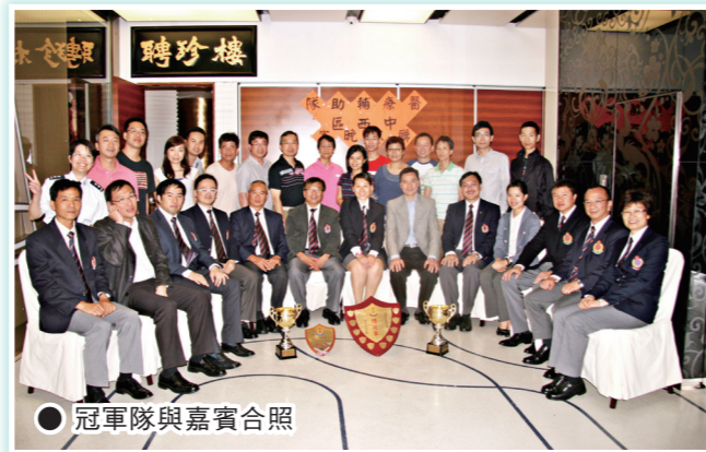
● 冠軍隊與嘉賓合照