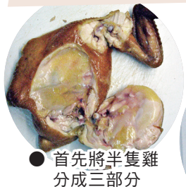
● 首先將半隻雞分成三部分