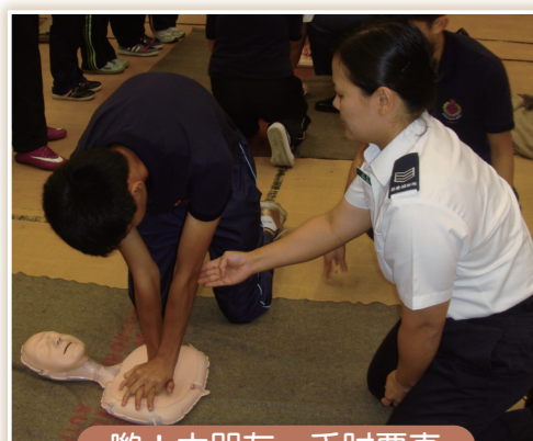
喲！大朋友，手肘要直