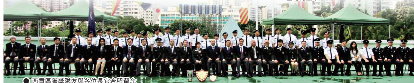
● 西貢區獲獎隊友與各位長官合照留念