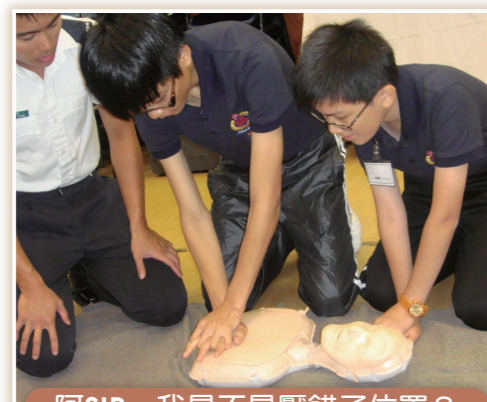
阿SIR，我是不是壓錯了位置？