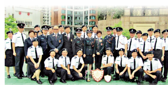
● 西貢區丙隊勇奪新界東總區比賽全場總亞軍