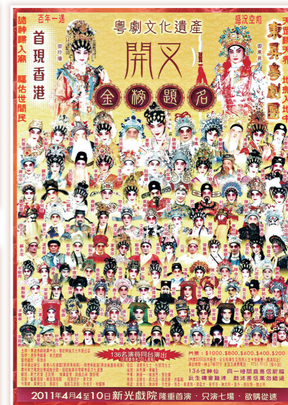
● 在《開叉》中出現過的136位諸神群仙都已羅列在宣傳單張上