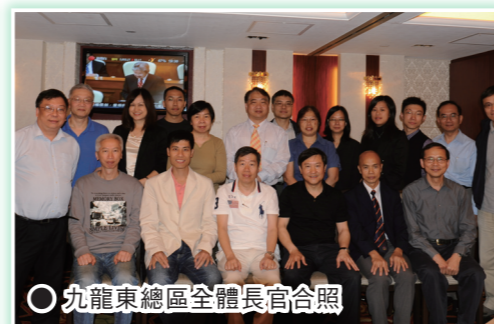
○ 九龍東總區全體長官合照