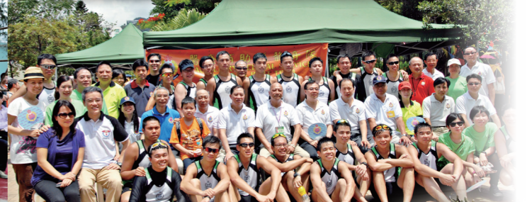
● 總參事及各高級長官前來打氣