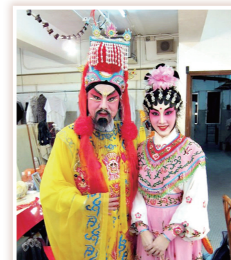
● 當然要與玉皇大帝來個合照啦！