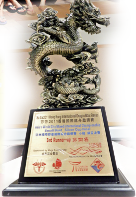
● 國際龍舟 - 亞洲國際都會混合錦標賽小龍銀盃賽殿軍獎項