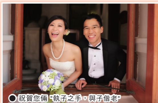
○ 祝賀您倆「執子之手，與子偕老」