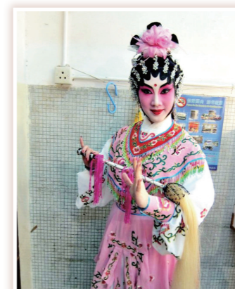
● 小妹有幸飾演瓊花仙子

此劇對上一次上演在80多年前，因此是次重演，可說是可一不可再，難得小妹有幸能夠參與是次演出，真是感到萬二分的光榮。