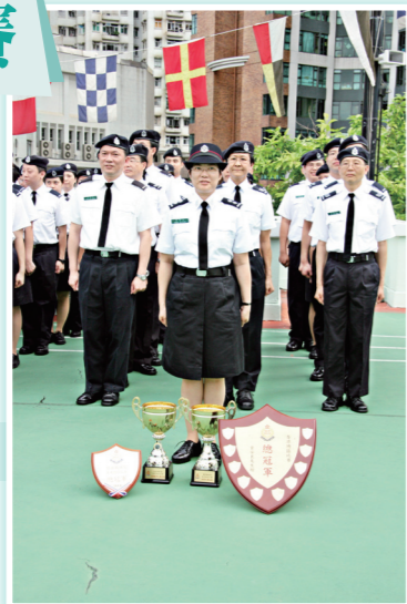
● 中西區甲隊全體隊員