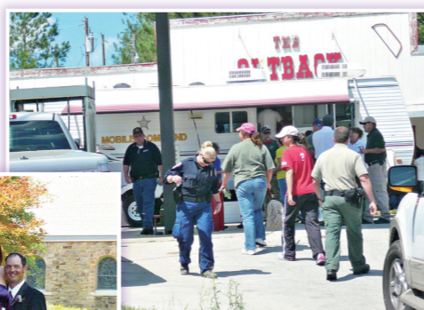
● 食肆臨時改為災難管理中心