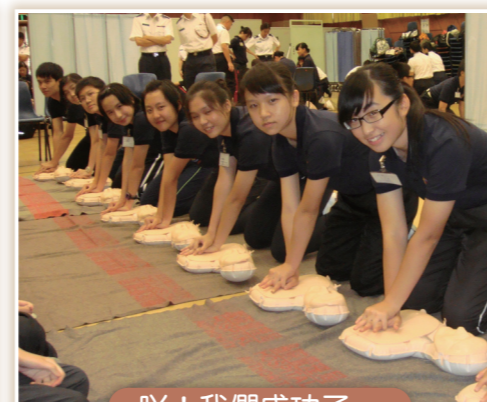
吶！我們成功了，看看我們的姿勢合格嗎？