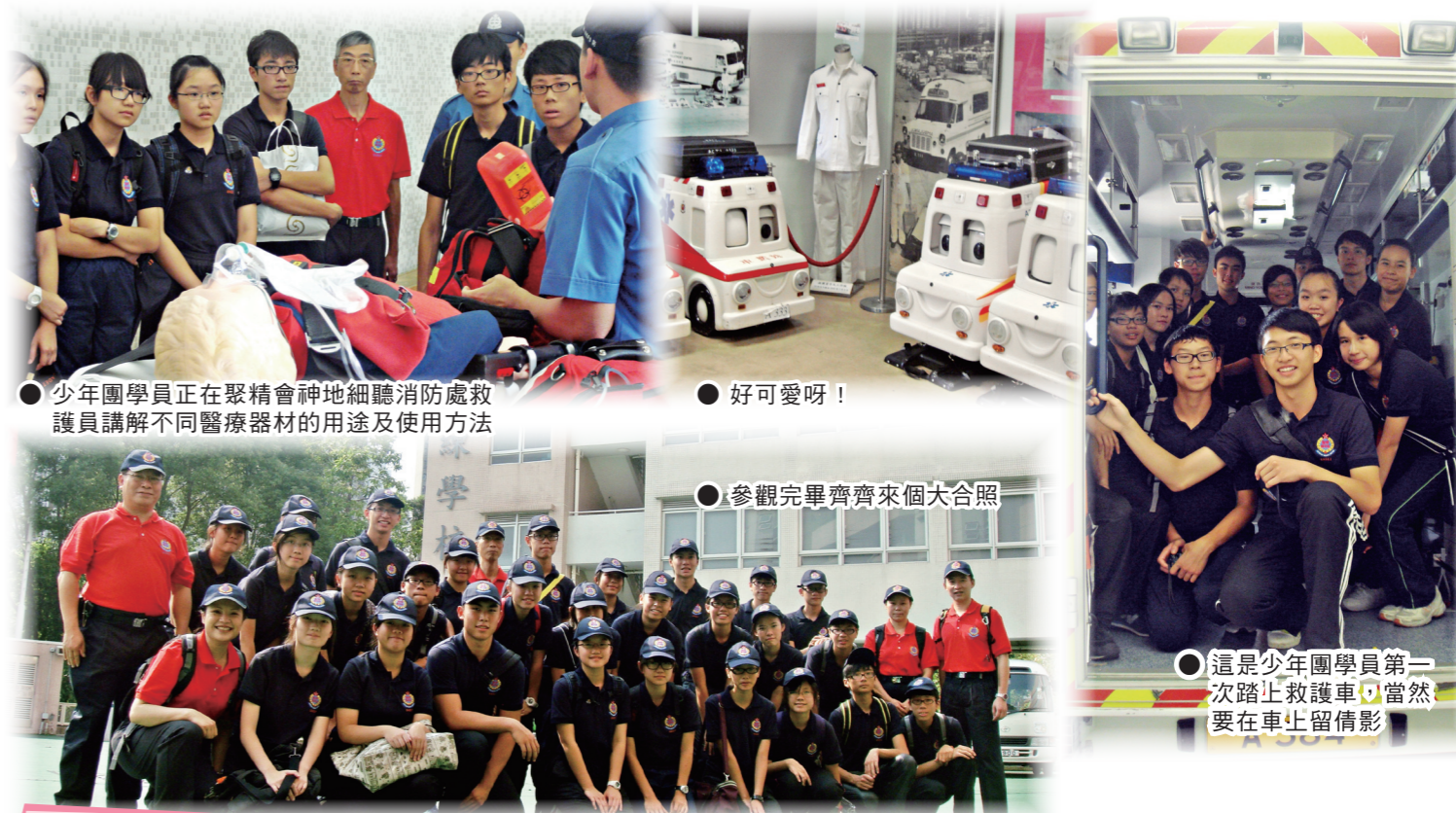
●少年團學員正在聚精會神地細聽消防處救護員講解不同醫療器材的用途及使用方法