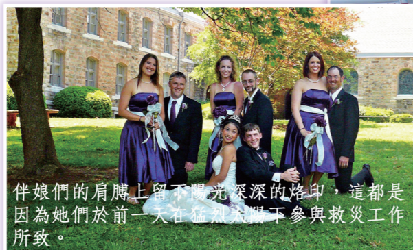
伴娘們的肩膀上留下陽光深深的烙印，這都是因為她們於前一天在猛烈風暴下參與救災工作所致。

的婚禮亦順利舉行。我們把部份婚宴的食物，送到災區，總算為災民盡一點力。天災無情，人間有愛，但願亞拉巴馬州災民能早日重建新生活。