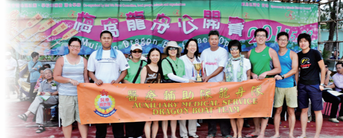
● 混合中龍金碟賽殿軍