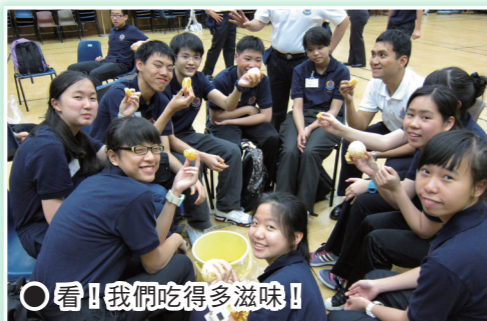
○看！我們吃得多滋味！