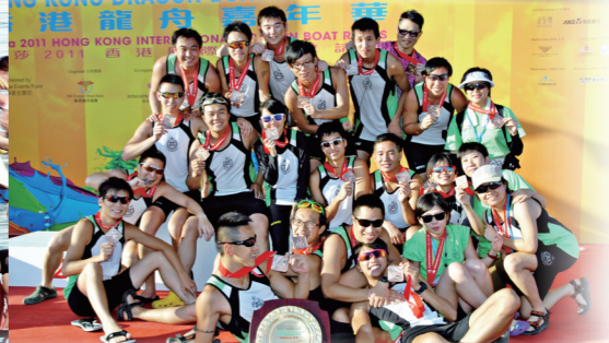
● 莎莎國際錦標賽季軍（歡顏儘顯辛酸淚）